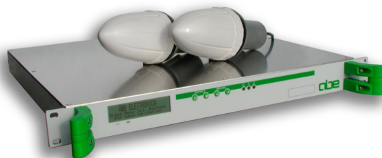
Рис. 4 Приемник - синхронизатор GNS1000 с двумя активными антеннами

Имеется возможность установки в одном модуле второго приемника GPS. Приемники могут работать от одной или от двух независимых антенн. Предусмотрена возможность установки двух термостабилизированных генераторов, двух источников питания. Такие конфигурации значительно повышают надежность системы. Особое внимание уделено важнейшему параметру - увеличению времени удержания синхронизации сети. Применены технические решения, повышающие стабильность частоты генератора 10 МГц как в связи со старением элементов, так и при изменениях температуры окружающей среды.