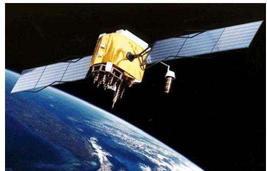
Рис. 2 Спутник GPS

Используя то обстоятельство, что местоположение приемника GPS для нашего применения является фиксированным, он при первом включении в течение 30 минут с высокой точностью определяет свое местоположение, запоминает его и использует в дальнейшей работе. Таким образом, приемник GPS в состоянии постоянно генерировать сигналы с необходимой точностью при наличии только одного видимого спутника.