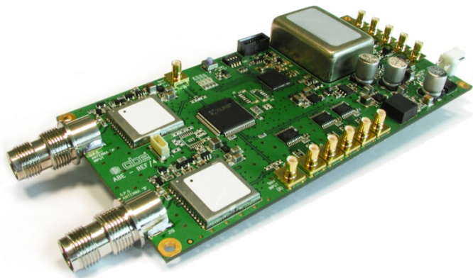
Рис. 3 Плата синхронизатора GNSS с двумя приемниками для двух стандартов (GPS+GLONASS) и опорный генератор

Сигнал GPS является крайне слабым. Из-за потерь в антенном кабеле, достигающем длины десятков метров, сигнал на входе приемника может оказываться недопустимо низким. В связи с этим предпочтительно иметь активную приемную антенну с предусилителем. С учетом проблем, связанных с шумами приемника, рекомендуется выбирать антенны с усилением, превышающим потери в антенном кабеле по крайней мере на 6 дБ.